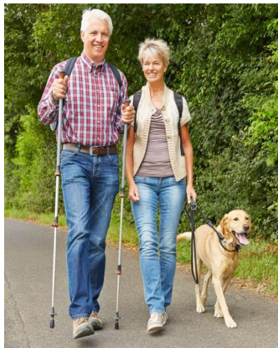
Andere leeftijd ... andere behoeftes en plannen.

U kunt natuurlijk ook iemand aanbevelen of voordragen.